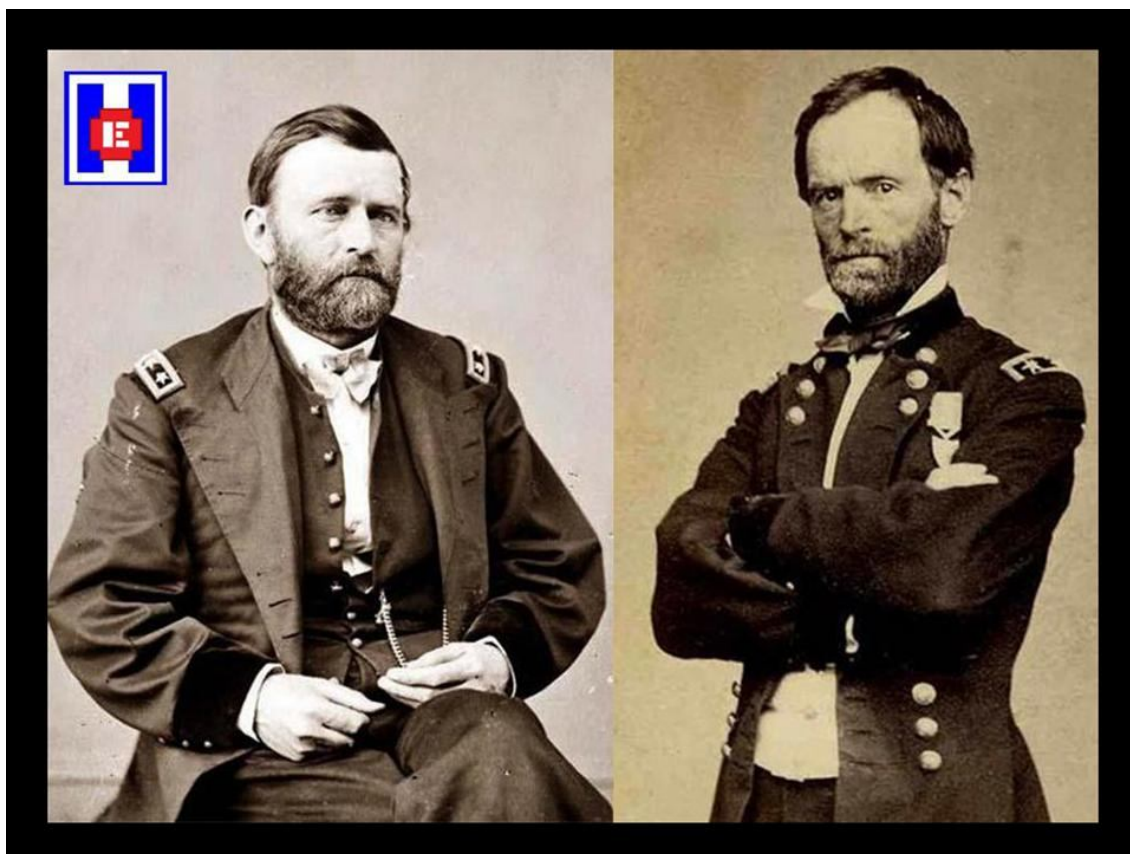
FOTO 4 Generales Ulysses S. Grant y William T. Sherman