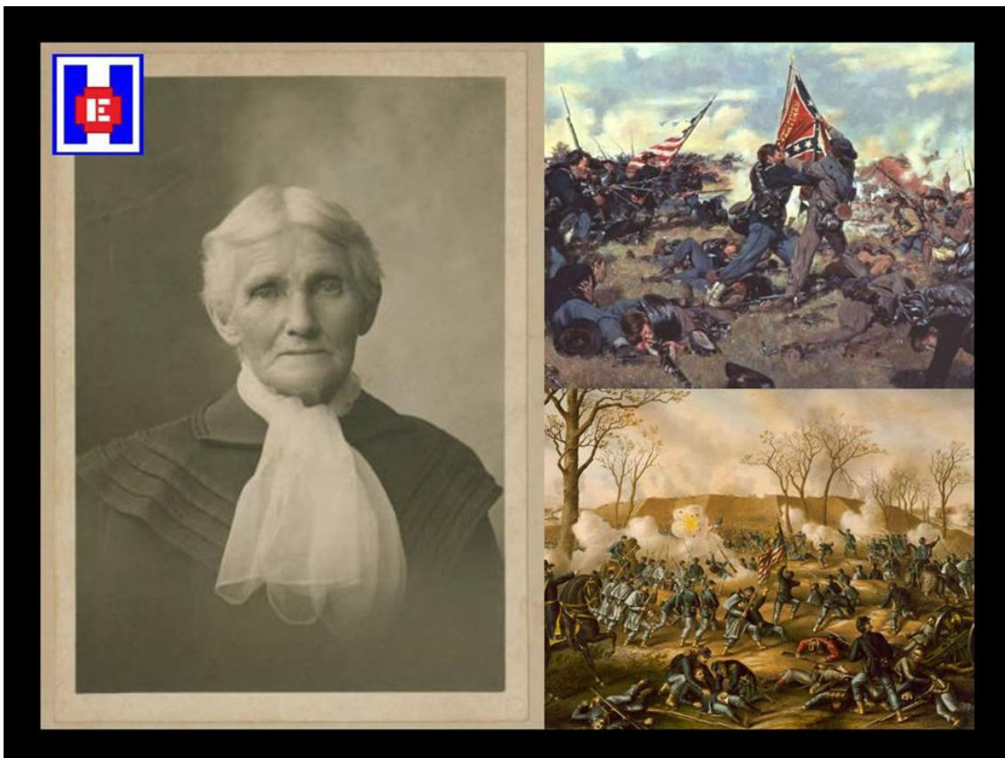
FOTO 1 Mary Ann Ball o Madre Bickerdyke. Batalla de Fort Donelson

Un gran número de hombres y mujeres laicos se ofrecieron como enfermeros voluntarios durante la Guerra de Secesión americana. Muchos de ellos destacaron como líderes y tuvieron una gran influencia en la enfermería de su tiempo. Todos proporcionaron un servicio compasivo a los soldados durante esas épocas de necesidad. Llevaron esperanza a los que habían sido abandonados y dieron fe a los que desesperaban. Cuidaron a los enfermos y heridos y consolaron a los moribundos. La mayoría eran jóvenes y principiantes, pero sus esfuerzos tuvieron un efecto positivo entre las tropas (1).