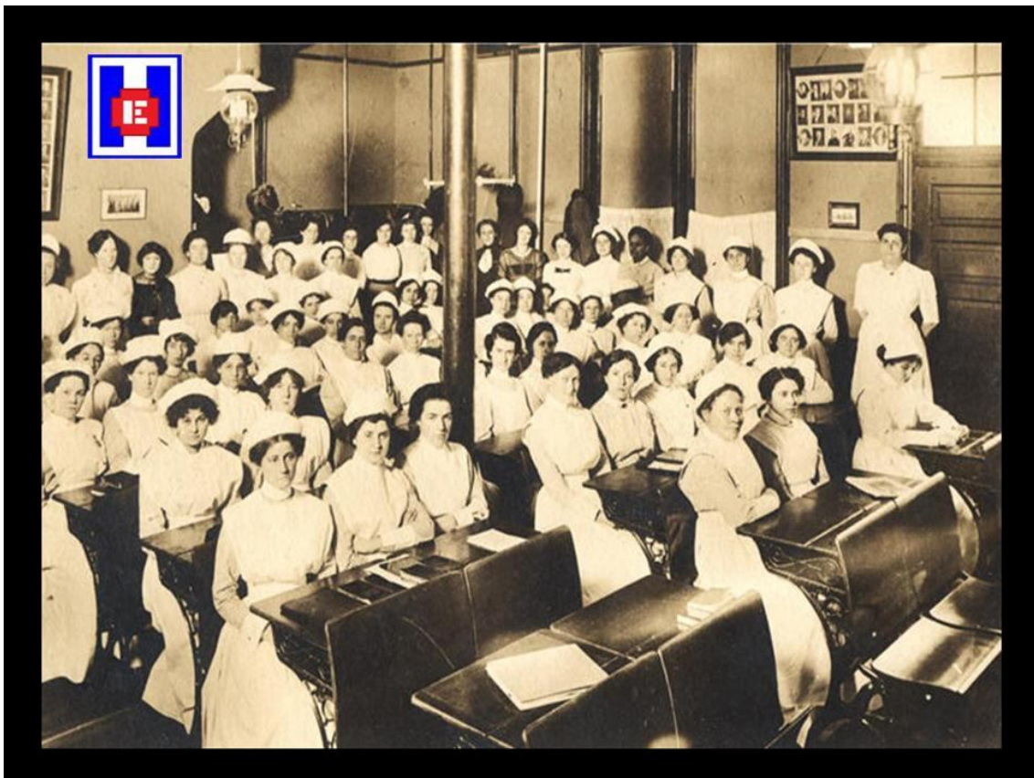
FOTO 2 En el aula de una clase de formación de enfermeras. Illinois