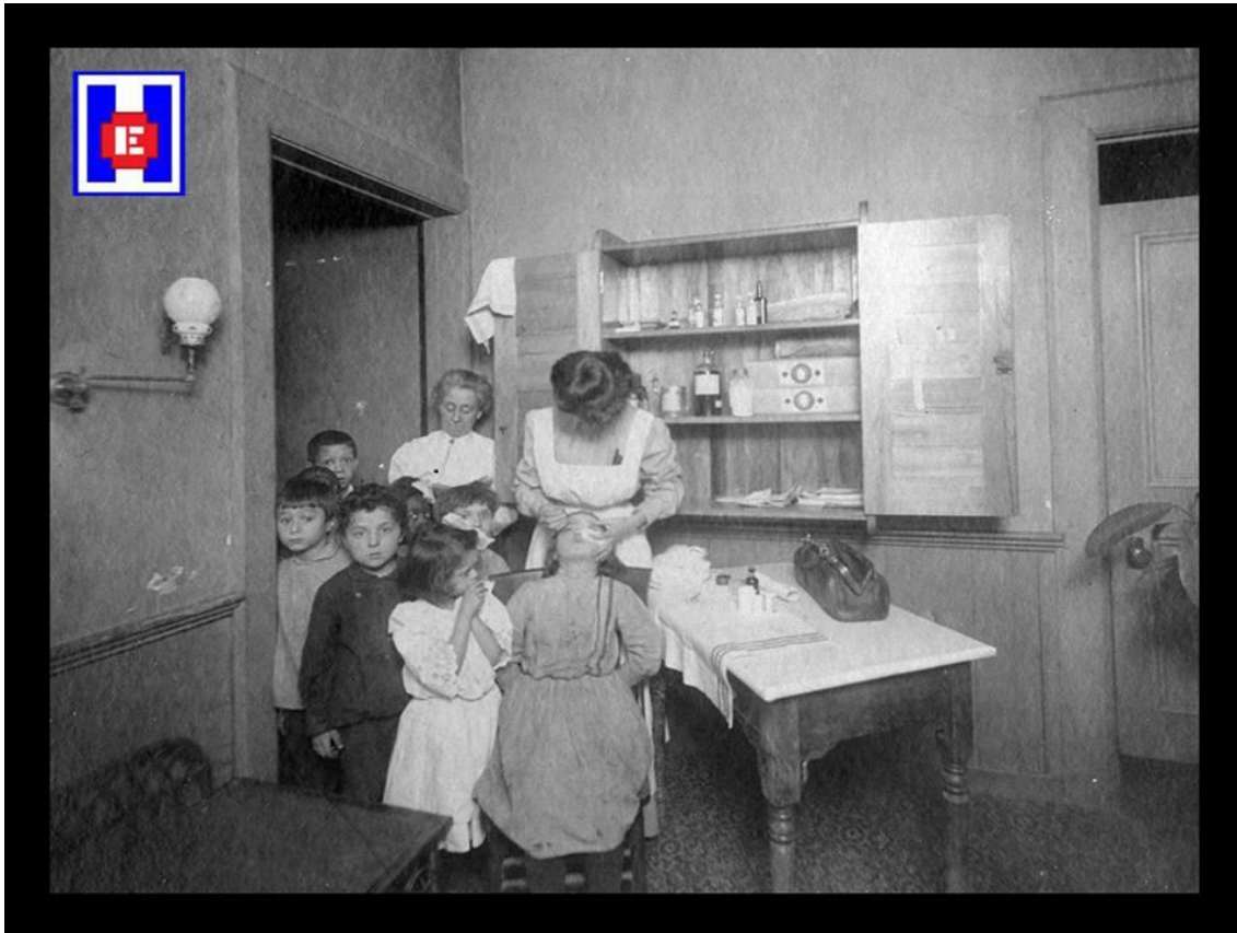
FOTO 5 Aunque Wald estaba desarrollando su nuevo trabajo para la reforma de la sociedad y la prestación de asistencia sanitaria, puso especial énfasis en la “campaña de salud pública”

superior de un edificio de viviendas en la calle Jefferson y comenzaron a llevar a cabo cualquier tarea de enfermería o labor social que cayera en sus manos. Al aumentar la cantidad de trabajo, compraron la casa del número 265 de la calle Henry con la ayuda, entre otros, de Jacob H. Schiff , banquero y filántropo judío.