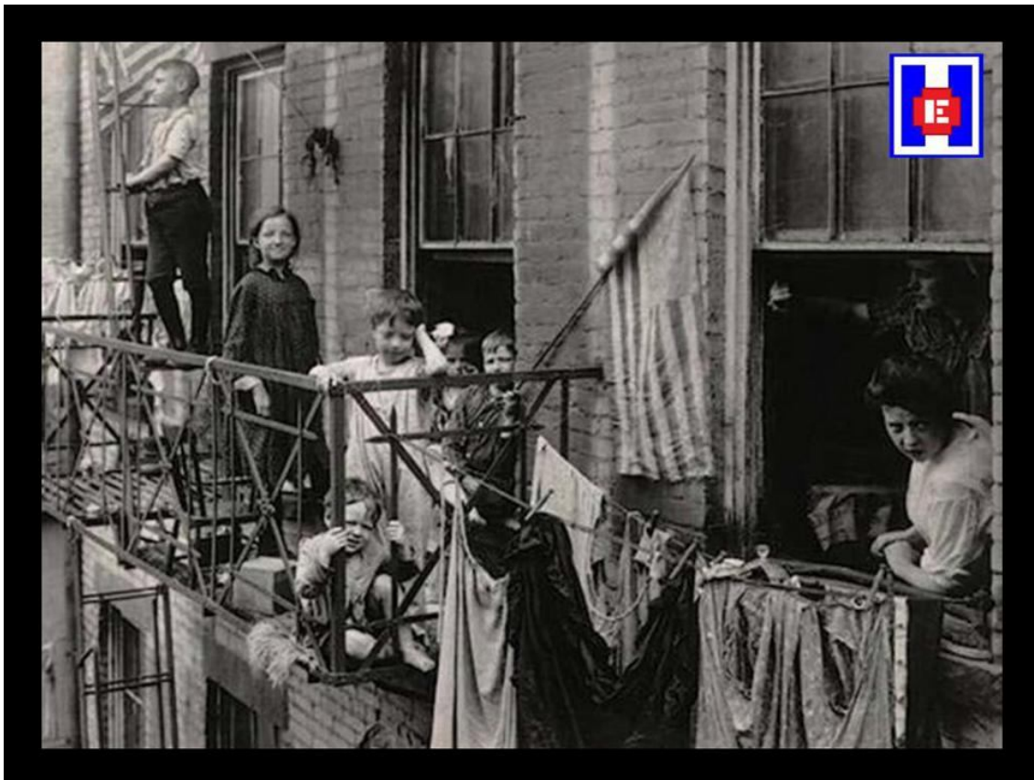
FOTO 7 Lillian Wald, Fundadora de la Enfermería de Salud Pública

La Institución de la calle Henry allanó el camino para la fundación de centros similares de enfermería en otras ciudades norteamericanas. Los primeros fueron los de Richmond, Virginia en 1900; San Francisco, California en 1900 y Orange, Nueva Jersey en 1903.