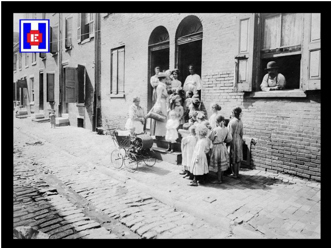
FOTO 4 Lillian Wald, fundadora de la Henry Street Settlement (1893) en la ciudad de Nueva York, inventó el término de enfermería de salud pública para poner énfasis en el valor de la comunidad.

Habría sido reconfortante que por alguna convicción de la indignidad moral de la familia me hubiera podido defender como parte de la sociedad que permitía la existencia de tales condiciones..., a pesar de lo miserable de su situación, no carecían de ideales sobre la vida familiar ni sobre la sociedad, de la cual eran una parte tan poco querida y marginada.