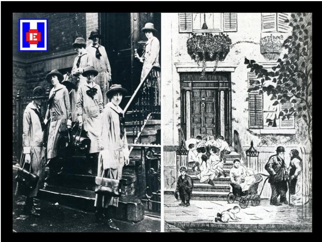
FOTO 3 La institución de la Calle Henry. Las enfermeras salen de la Institución de la Calle Henry para ir en ayuda de los pobres y necesitados en la zona sur de Manhattan a principios de los años 1900. La Casa de la Calle Henry, portada para el libro de Lillian Wald, 1915.

Describió este cambio en su vida en el siguiente pasaje: