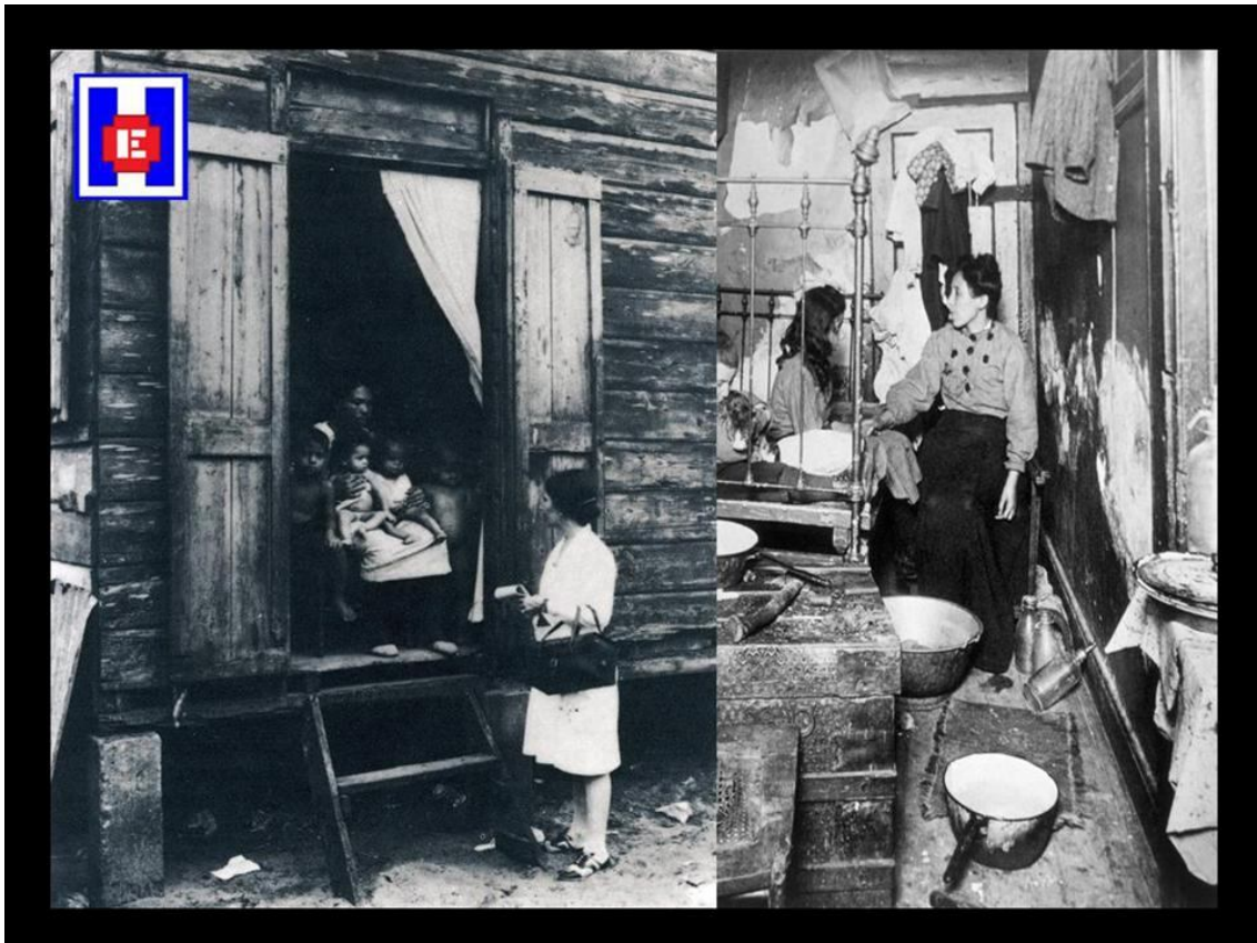
FOTO 6 Enfermera visitadora. Puerto de tierra. La visita a domicilio. Familia

Creó un sistema por el cual los pacientes tenían acceso directo a las enfermeras y las enfermeras tenían acceso directo a los pacientes. Miss Wald insistió en que las enfermeras debían estar a disposición de la gente que las necesitaba, sin la intervención de un médico (4).