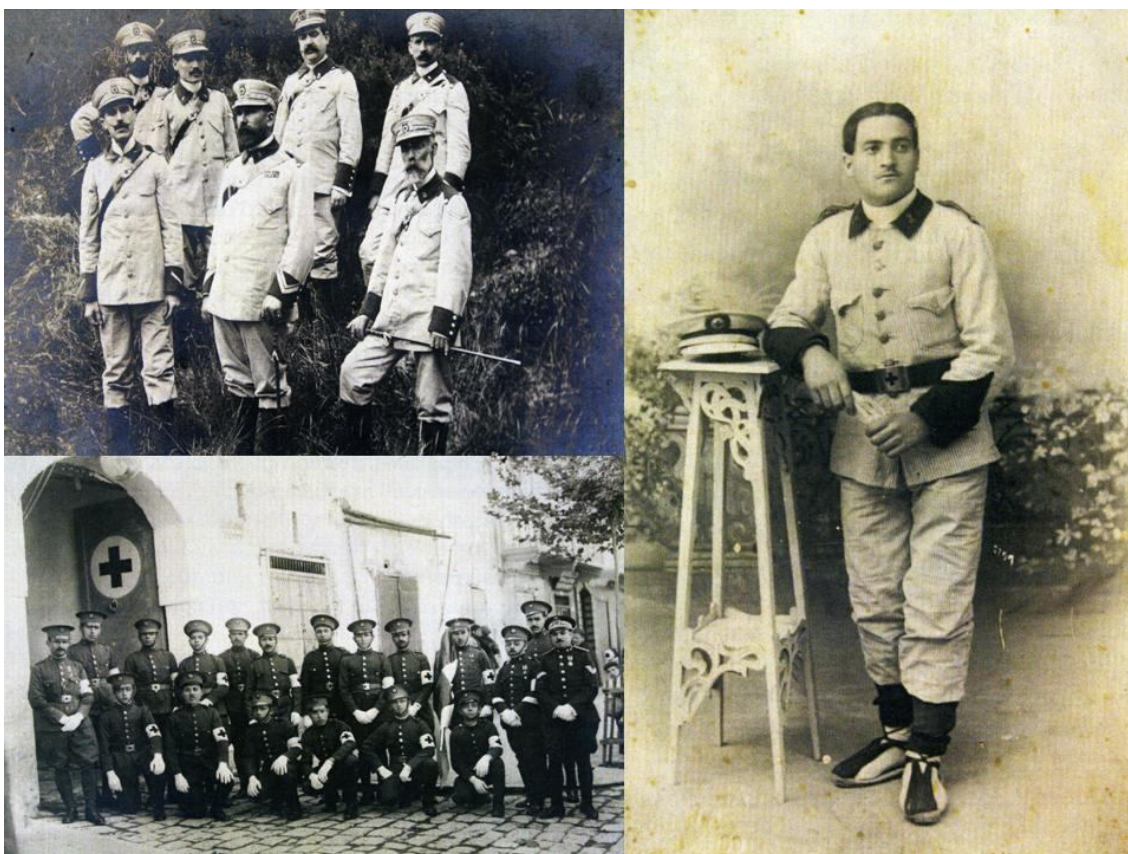
FOTO 006 Grupo de Jefes de la Cruz Roja con uniforme de rayadillo. Cruz roja de Tetuán con uniforme caqui. Uniforme de camillero, época de Alfonso XIII.

Uno de los fines del dispensario antituberculoso era atender a los tuberculosos y a las personas sin recursos. La colonia infantil se realizó en el Sanatorio de Oza hoy en día llamado "Sanatorio Marítimo Nacional de Oza" situado en La Coruña. Este sanatorio se inaugura en 1910 como centro especializado en niños pretuberculosos y la tuberculosis ósea. En el año 1929 los Reyes Alfonso XIII y Victoria Eugenia inauguran el pabellón de Colonias destinado a acoger Colonias escolares. En el año 1923 la colonia infantil estaba formada por cinco niñas y cinco niños. Al año siguiente y gracias a la recaudación del año anterior en la Fiesta de la Flor , se envió a Oza durante dos meses a 15 niñas y 10 niños. En los años sucesivos los niños y las niñas iban creciendo en número.