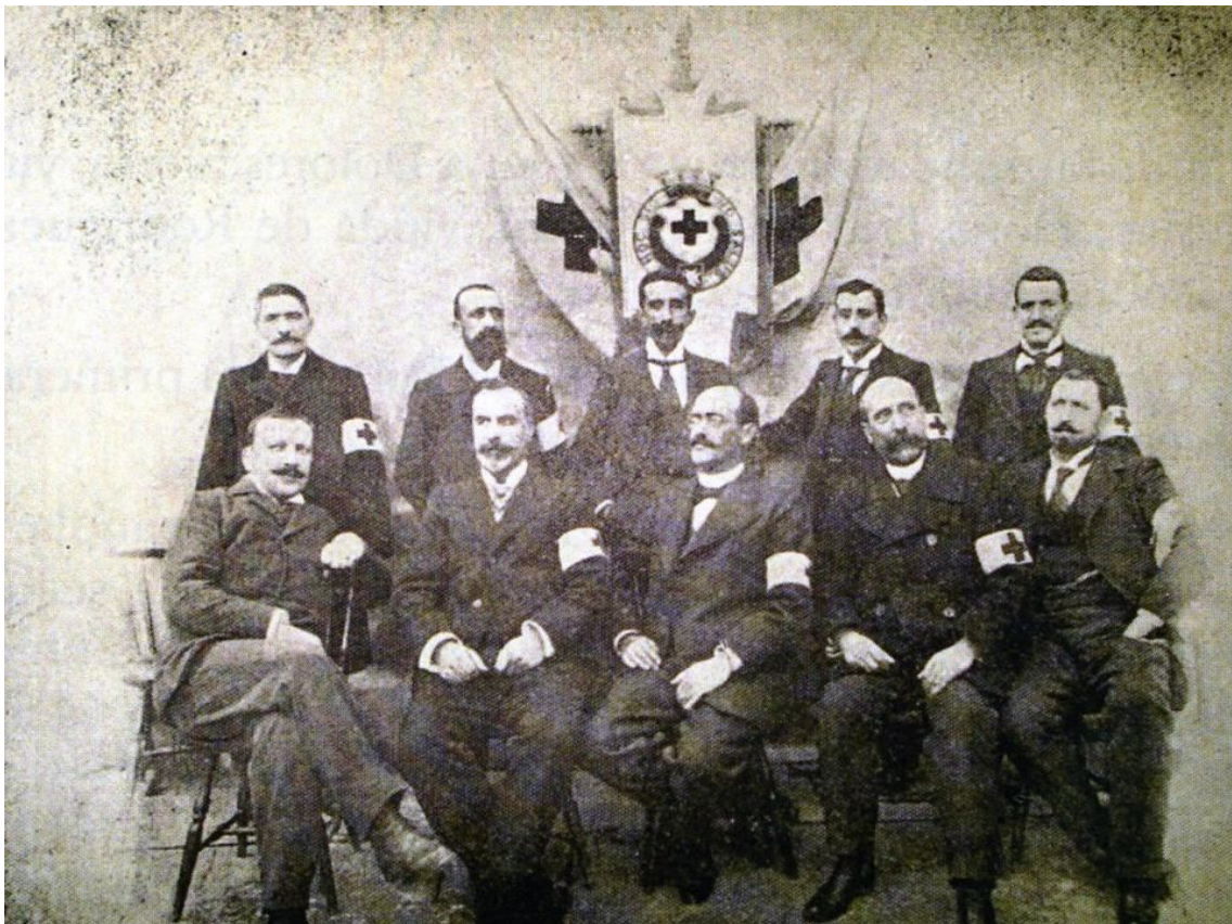
FOTO 005 Junta de Gobierno.