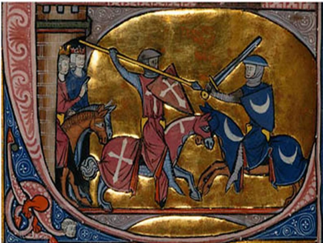
FOTO 003 Orden Hospitalaria de San Juan de Jerusalén