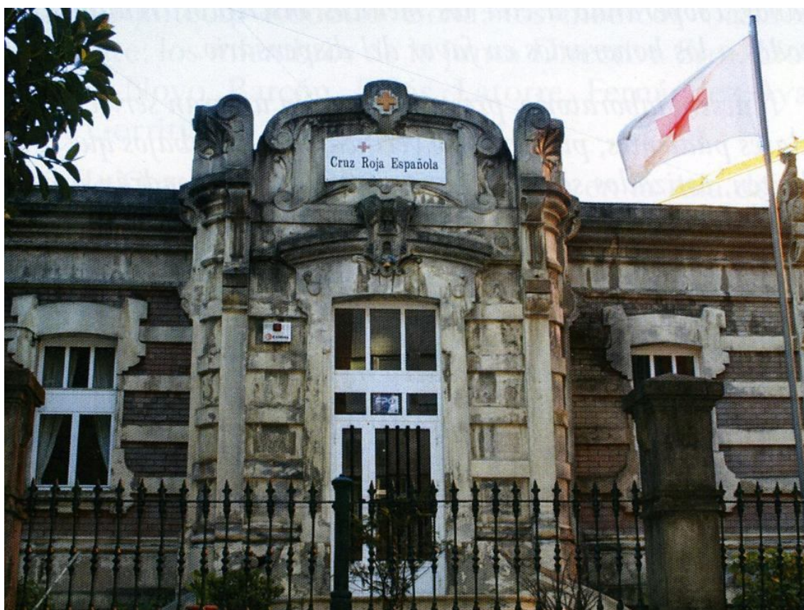
FOTO 004 Vista frontal del antiguo Dispensario. Hoy sede comarcal de la Cruz Roja Ferrolana.