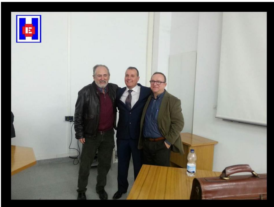
FOTO 6 Directores de la Tesis Doctoral

Y por último, en base al criterio taxonómico cuantitativo , es seriada , es decir tanto los distintos soportes que puede presentar el objeto de estudio como propiamente estos por sí solos son susceptibles de ser ordenados y clasificados atendiendo a un muy variado conjunto de aspectos y categorías, algunos generales y estrictamente filatélicas -país, año de emisión, motivo de emisión, motivo del sello, uso postal etc.-, y otros de índole más específico y por tanto pertinente para los objetivos pretendidos con nuestra investigación, es decir en torno a la Enfermería.