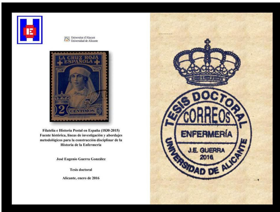
FOTO 1 Portada y contraportada de la Tesis Doctoral

Filatelia e Historia Postal en España (1830-2015). Fuente histórica, líneas de investigación y abordajes metodológicos para la construcción disciplinar de la Historia de la Enfermería