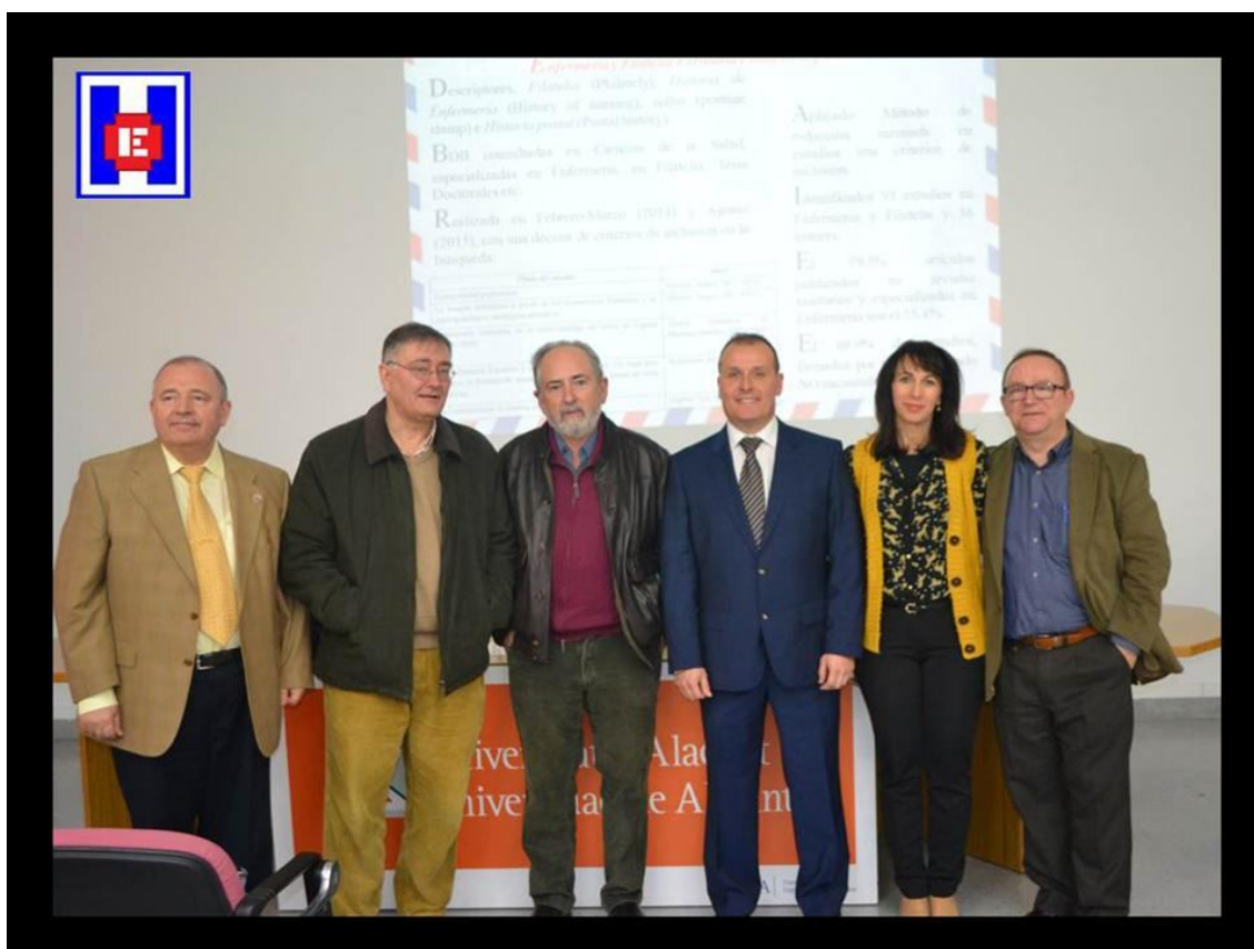
FOTO 2 Tribunal y directores de la Tesis Doctoral

Posteriormente a la lectura de la tesis, el tribunal y los asistentes terminaron el día con un almuerzo en el Club Social I, degustando unos entrantes variados y platos principales de arroz y bacalao, todos ellos exquisitos además de un buen vino en el que los comensales amenizaron con sus charlas, comentarios etc.