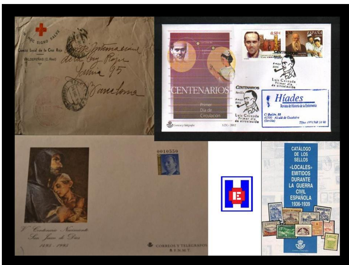
FOTO 8 Remitente, el Comité local de la Cruz Roja de Valdepeñas en Ciudad Real. El destinatario, el Comité Internacional de la Cruz Roja, en la calle Lauria de Barcelona. 1938. 175 Aniversario del nacimiento y centenario del fallecimiento del Dr. Federico Rubio y Gali. V Centenario del nacimiento de San Juan de Dios. Catálogo de sellos de la Guerra Civil española 1936 - 1939

4.- Así mismo, los investigadores identificados en tal vertiente de estudio ascienden a casi una treintena, siendo su productividad, fundamentalmente, de un artículo, y preferentemente rubricados por un único firmante. Es justo a la vez que esperanzador reflexionar acerca del hecho de que existen al menos dos grupos de investigadores consolidados en esta línea con una trayectoria mantenida en el tiempo y una producción científica relevante. Es nuestro anhelo el que esta línea de investigación, Enfermería y Filatelia e Historia Postal, se extienda paulatina y firmemente por todo el territorio nacional. Así mismo, la producción debería aumentar progresivamente, pero con una autoría más numerosa –interdisciplinar y/o multidisciplinar–, más firmantes en la autoría de éstos, pudiendo resultar más enriquecedor si cabe.