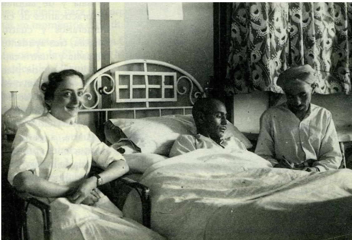
Hospital Musulmán. Paciente aprendiendo a leer y escribir en español. Heraldo de Aragón 5-VI-1937

El hospital instalado en los edificios de “ Hacienda ” y “ Colegio Gascón y Marín ” se dedicó para el ingreso de heridos, mientras que el Colegio de los Corazonistas se utilizó para el ingreso de enfermos. Muchos de los pacientes llegaban evacuados desde el mismo frente, como Brunete, entre julio y agosto de 1937, Belchite, en octubre de 1937, y Teruel y el Ebro en 1938. Rara vez venían de otros hospitales de la ciudad, ya que eran evacuados directamente desde los puestos de clasificación, incluso en las mismas camillas usadas por los camilleros en el frente. Hubo momentos puntuales que al estar llenos los tres edificios, hubo que ingresar como se pudo, es decir, a los leves de dos en dos en una misma cama, sentados en los pasillos, recostados en las escaleras o directamente en el suelo en sus camillas, mientras en la calle esperaban las ambulancias llenas de heridos, a que se evacuara a los que eran dados de alta para poder ingresarlos en las camas que dejaban libres. Se calcula que pudieron pasar por sus salas unos 39.000 pacientes, de los cuales, entre los que llegaron muertos y los que fallecieron en el hospital, fueron enterrados más de 2.000.