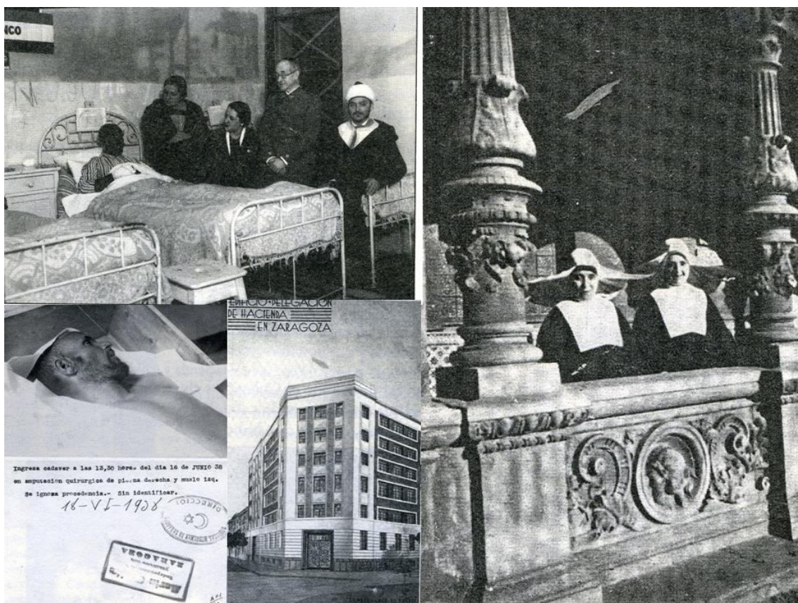
FOTO 004 Cadáver del archivo hospital militar de Zaragoza. Visitando a un herido. Hermanas de la Caridad, todas las fotos del Hospital Musulmán