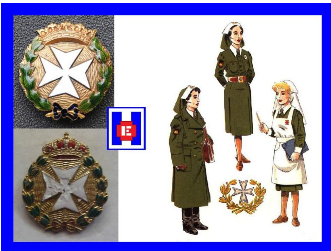
FOTO 005 Insignia maciza de bronce de 3,5 milímetros por 3,5 milímetros, tiene en el centro esmaltada la cruz blanca de malta orlada por una ramas de laurel unidas abajo por un lazo azul y arriba la corona real

Asimismo, se incorpora en el presente texto un capítulo dedicado a un cuerpo que de una u otra manera han pertenecido al colectivo de Enfermería militar, estas son las Damas Auxiliares de Sanidad Militar , quienes forman un colectivo con personalidad propia desde finales de la Guerra Civil hasta hace unos años que fueron declaradas a extinguir e incorporadas, las que reunían los requisitos, al colectivo de reservistas voluntarios.