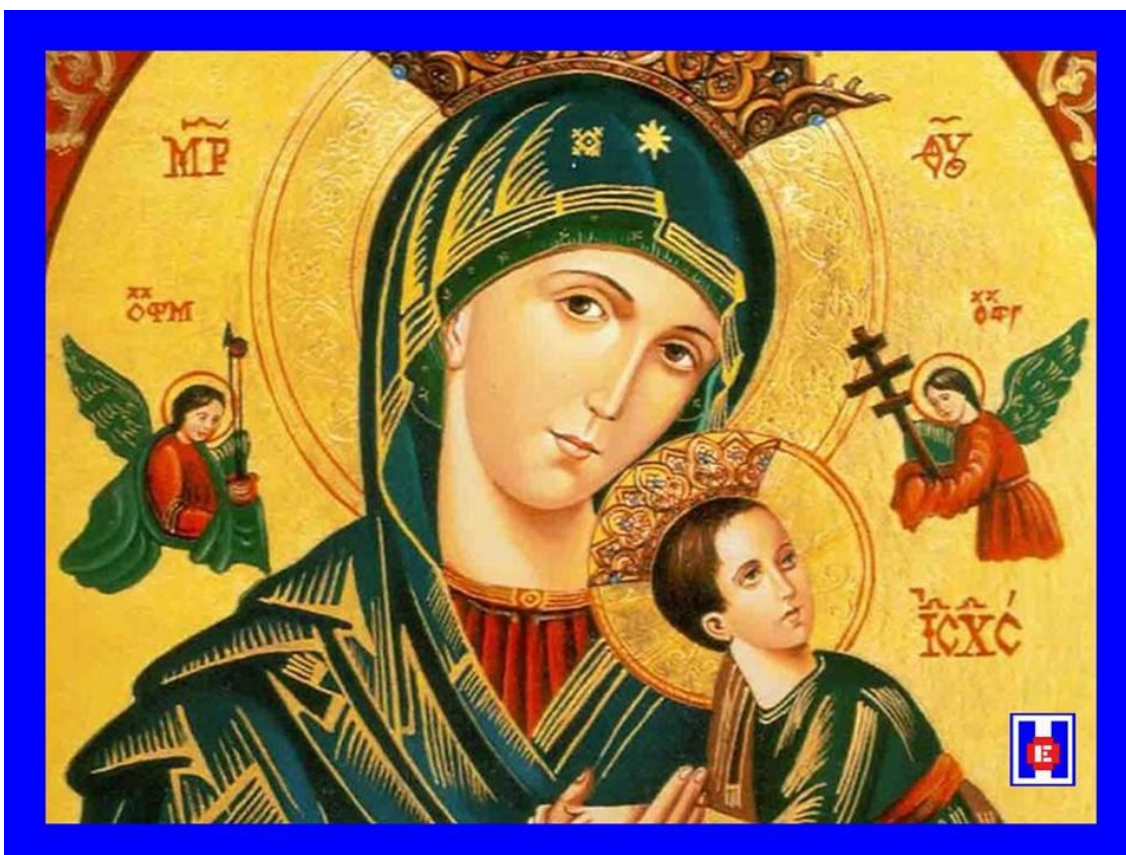
FOTO 007 Virgen del Perpetuo Socorro. Icono oriental antiguo de origen desconocido. El icono de la Virgen, pintado sobre madera de 21 por 17 pulgadas, muestra a la Madre con el Niño Jesús, el icono original está en el altar mayor de la Iglesia de San Alfonso, muy cerca de la Basílica de Santa María la Mayor en Roma

Tradicionalmente, las Armas y Cuerpos de las Fuerzas Armadas gozan de la advocación de un patrón o patrona. En el caso del “Cuerpo y Tropas de Sanidad Militar” se trata de