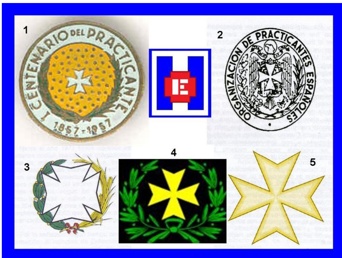
FOTO 006 (1) Medalla del Centenario del Practicante 1857 – 1957. (2) Emblema de los Practicantes en Medicina españoles. (3) Emblema de los Ayudantes Técnicos Sanitarios. (4) Emblema del Cuerpo Militar de Sanidad entre dos ramas de olivo. (5) Emblema del Cuerpo Militar de Sanidad (común para todas las especialidades fundamentales)

Está claro que en el Reglamento sólo en el artículo 446 habla de consideración y paga del empleo de Sargento primero, resultando por tanto la única graduación que tenían en ese momento. Tampoco se puede hablar de competencias profesionales definidas para estos practicantes, pero por lo visto en el articulado se deduce que su actuación se dirigía a las actividades quirúrgicas en los hospitales, acuartelamientos y, sobre todo, en el campo de batalla, así como la realización de las curas en botiquines, evacuación y traslado de heridos, principalmente.