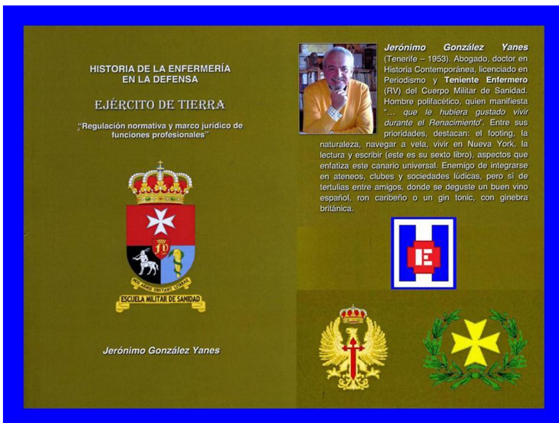
FOTO 002 Portada y contraportada del libro

“Regulación normativa y marco jurídico de funciones profesionales”