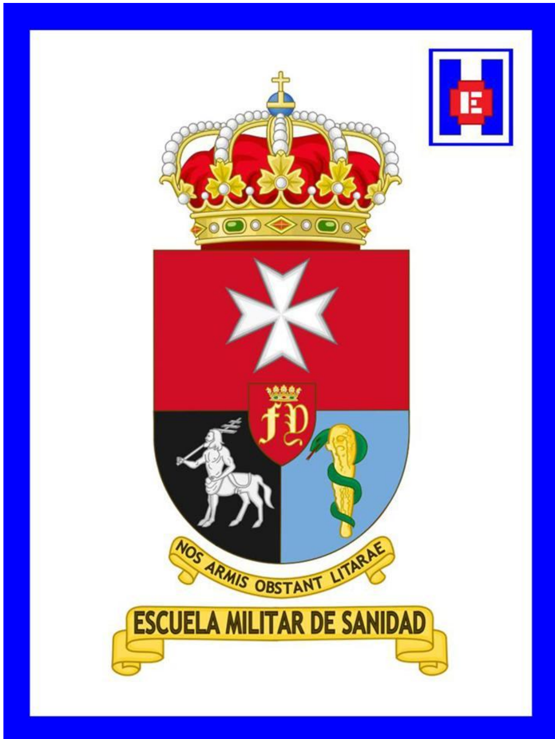
FOTO 003 Escudo de la Escuela Militar de Sanidad, presidido por la Cruz de Malta (emblema del Cuerpo Militar de Sanidad), aparece en el listón la leyenda “Non armis obstant litarae”, en referencia a la permanente convivencia de la Cultura y la Ciencia, con el ejercicio de las Armas

esta especialidad fundamental de los Cuerpos Comunes, ha sufrido con el devenir de los tiempos.