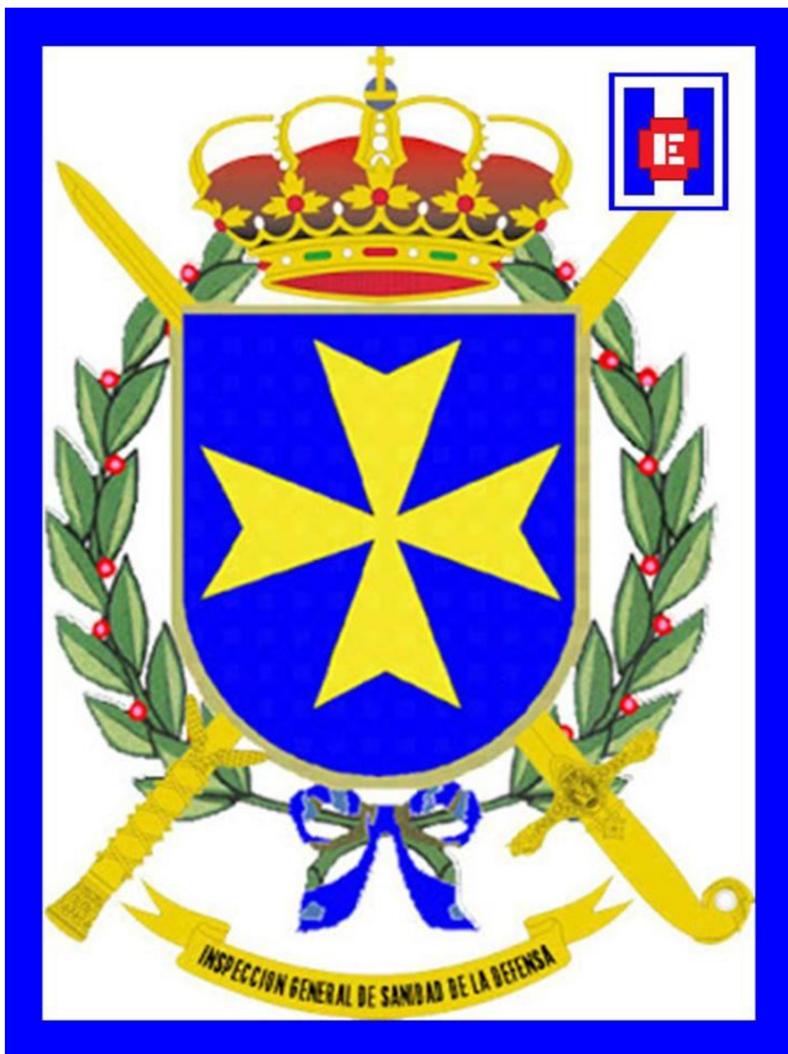
FOTO 008 Emblema de la Inspección General de Sanidad de la Defensa