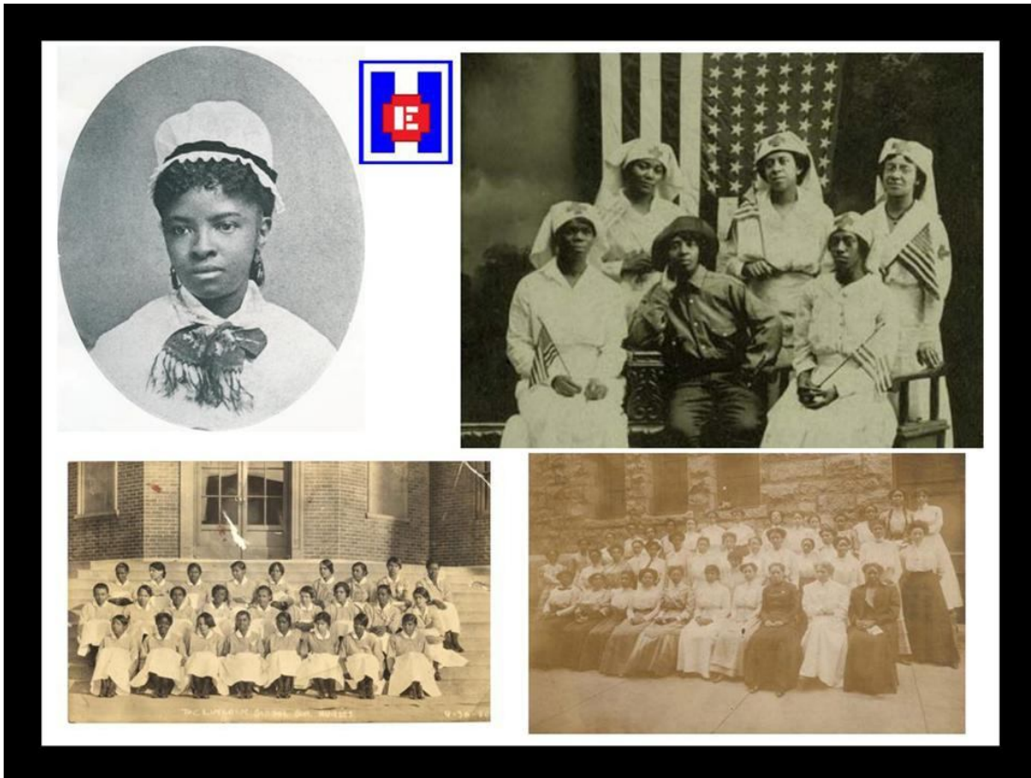
FOTO 7 Retrato de Mary Eliza Mahoney (Biblioteca pública de Nueva York). La primera enfermera graduada afro-americana. Escuela de enfermeras Lincoln. La primera convención de la Asociación Nacional de Enfermeras Graduadas de color en Boston, 1909

marcha dos instituciones similares, el Hampton Institute en Virginia y el Provident Hospital en Chicago.