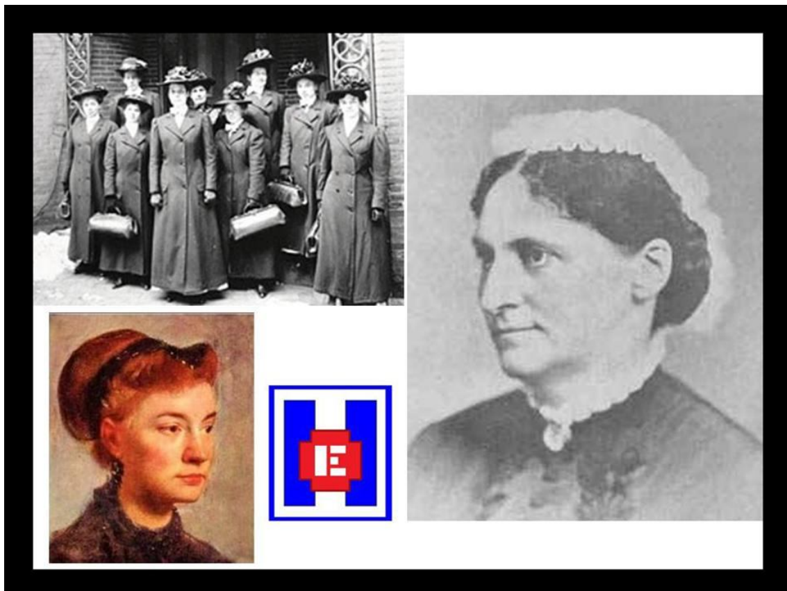
FOTO 6 Desarrollo de la Sociedad de Enfermería de distrito, 1886. Dra. Marie Zakrzewska y la enfermera Linda Richards

Esta Escuela estaba bajo la dirección de la Dra. Susan Dimok . Las estudiantes de enfermera trabajaban de 5,30 de la mañana hasta las 9 de la noche y dormían en las habitaciones que había cerca de la sala con el fin de estar inmediatamente disponibles si eran requeridas. Su uniforme consistía en un sencillo vestido de percal y zapatillas de fieltro. La Dra. Marie Zakrzewska enseñaba los detalles más sencillos de la enfermería. No había enfermeras jefe ni directoras. La Escuela siguió creciendo, y en 1882 el curso se amplió a 16 meses. Para entonces, la escuela contaba con dos enfermeras jefe y una directora. El programa se extendió a 2 años en 1893, y finalmente, a tres en 1901.