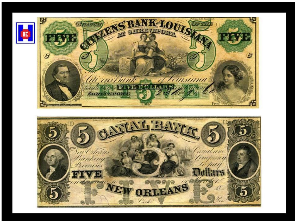
FOTO 5 Billeto de 5 dólares del Banco de Louisiana y del Banco de New Orleans, 1857

A las estudiantes de enfermera se les exigía que asistieran al curso completo de 6 meses, que comprendía clases prácticas junto al lecho del paciente. El primer mes era un periodo de prueba. Pocas mujeres hicieron la solicitud, y sólo seis completaron los estudios durante los dos años siguientes. En 1872 el hospital se trasladó a un nuevo edificio en Roxbury, Massachusetts , y admitió una clase de cinco estudiantes en su recién creada escuela de formación. El plan específico de la Escuela se ha descrito de la siguiente manera (6):