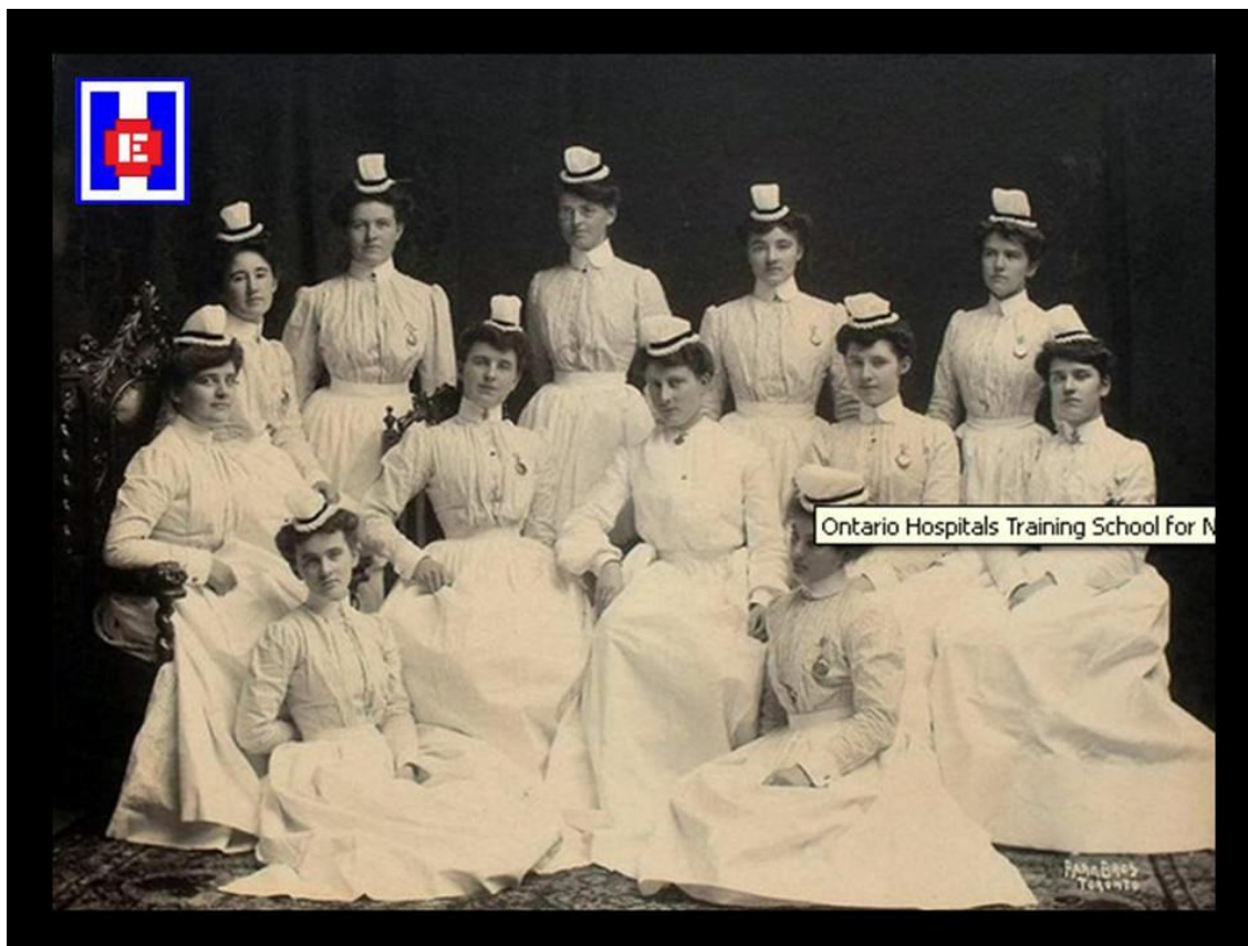
FOTO 4 Canadian Training School. Enfermeras graduadas 1874

Los informes de la época se refieren a esta organización como la “ Primera Escuela de Formación de Enfermería fundad en América ” y la “ Primera Escuela de América establecida para preparar a las mujeres como Enfermeras ”. En 1897 el programa de formación se prolongó a un año (5).