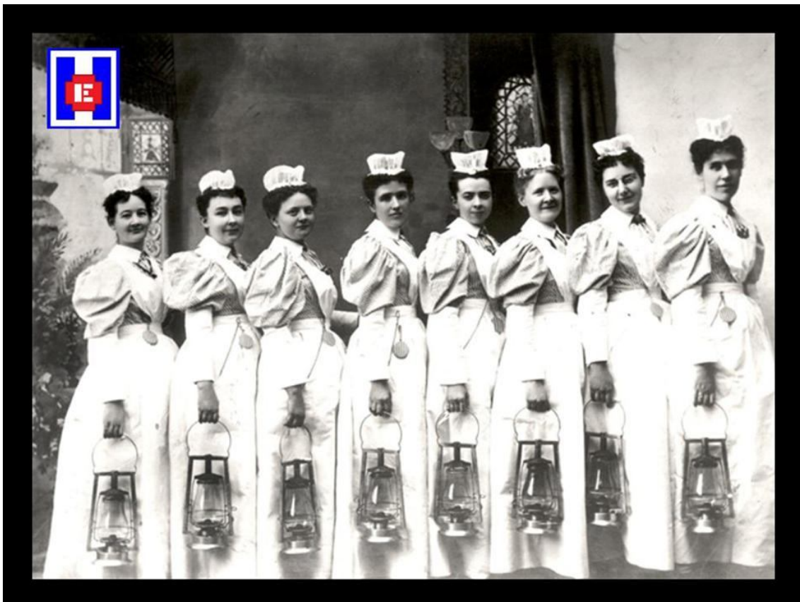
FOTO 8 Escuela de Formación para Enfermeras de Connecticut 1896

La enfermera hábil, mediante el control minucioso de la temperatura, las condiciones de la piel, el pulso, la respiración y las funciones de todos los órganos, y con una información fidedigna al médico de servicio, ha de multiplicar por dos las probabilidades de recuperación (8).