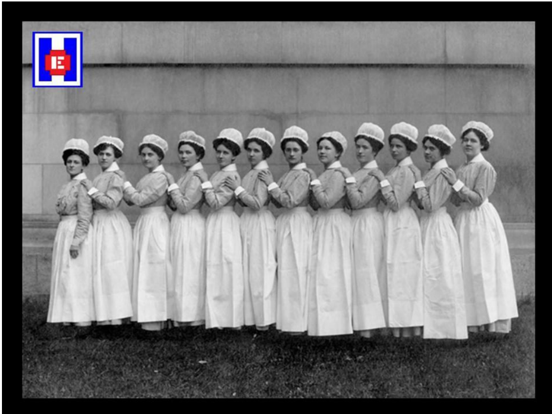
FOTO 9 Bellevue Training School Nurses 1880

Se crearon ese año: el 1 de mayo se creó la Bellevue Training School en la ciudad de Nueva York, el 1 de octubre se creó la Connecticut Training School y el 1 de noviembre se creó la Boston Training School que más tarde se convertiría en la Massachusetts General Hospital Training School for Nurses . Estas Escuelas se basaron al principio en el modelo de Florence Nightingale, pero pronto se vieron en la obligación de desviarse y seguir otro camino (9).