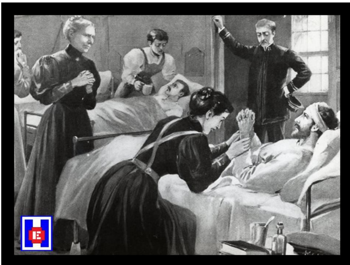
FOTO 1 Estoy con los heridos. Portada del The Christian Herald Association 1898

Las experiencias de la Guerra de Secesión o guerra civil estadounidense ( American Civil War o simplemente Civil War en Estados Unidos, 1861 – 1865), pusieron de manifiesto la inadecuada preparación de la mayoría de enfermeras que en ella habían tomado parte. Así se despertó el interés público por la Profesión de Enfermería, y poco a poco fue aumentando la conciencia de la necesidad de desarrollar y crear programas adecuados para la formación de las enfermeras. Este movimiento estaba respaldado por el gran número de mujeres de familias socialmente respetables que habían servido. Su compromiso y apoyo conferían un cierto grado de respetabilidad a la imagen de la enfermería (1).