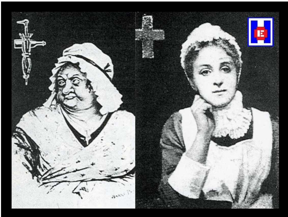
FOTO 2 Enfermera 1838 y enfermera 1888. Suplemento del Nursign Record , 20 de diciembre de 1888

La necesidad de enfermeras era grande, sin embargo, según Hale, esta necesidad también suponía un programa de preparación bien elaborado que generará “Enfermeras Profesionales”. Su consejo fue seguido, y con el tiempo se establecieron y proliferaron las “Escuelas de Formación para Enfermeras” (2).