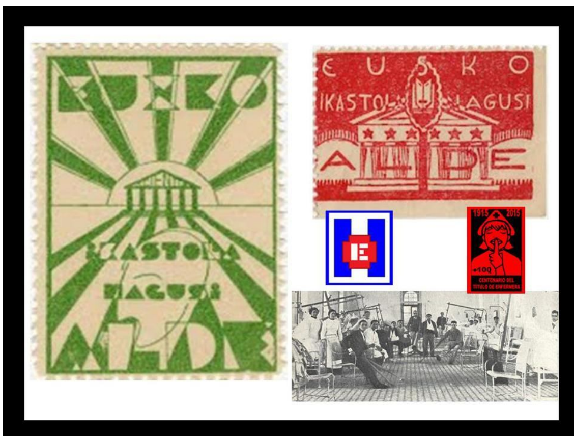
FOTO 1. Sello de la campaña pro-universidad vasca Eusko Ikastola Nagusi Alde , 1932-33 de Eusko Ikaskuntza. Fuente: Fundación Sabino Arana. Sello de la campaña pro-universidad vasca Eusko Ikastola Nagusi Alde , 1932-33 de Eusko Ikaskuntza. Fuente: Fundación Sabino Arana. Sala para militares heridos 1937

La creación de una universidad vasca había sido una aspiración que venía gestándose desde finales del siglo XIX. En la primera década del siglo XX este movimiento a favor de la para crear una universidad pública vasca, va tomando cuerpo. En este sentido, destacan la moción del Ayuntamiento de San Sebastián en 1914, las diferentes iniciativa promovidas por Eusko Ikaskuntza / Sociedad de Estudios Vascos, que incluso llevan a la elaboración de estatutos para esa futura universidad 1 .