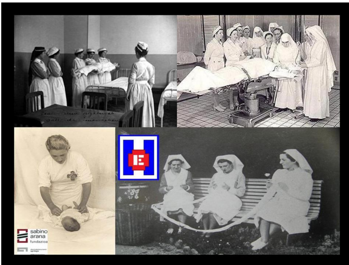
FOTO 8. Escuela de Enfermería. Escuela de enfermería: prácticas en quirófano. Enfermera (Fundación Sabino Arana). Enfermeras (La sanidad militar en Euzkadi)

Se apuesta por una formación de calidad integrada en el ámbito universitario, que hubiera supuesto un claro avance para la profesión enfermera.