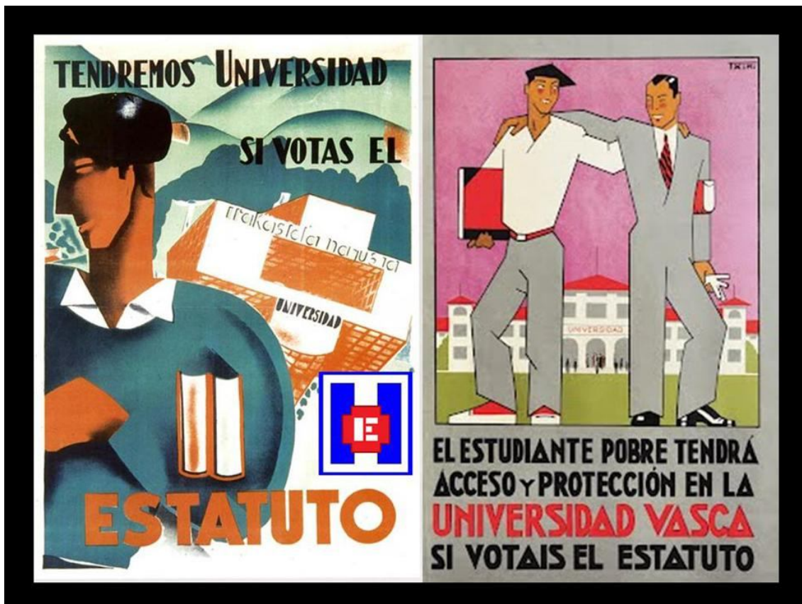
FOTO 2. Carteles a favor del Estatuto vasco, con la universidad vasca como elemento central.