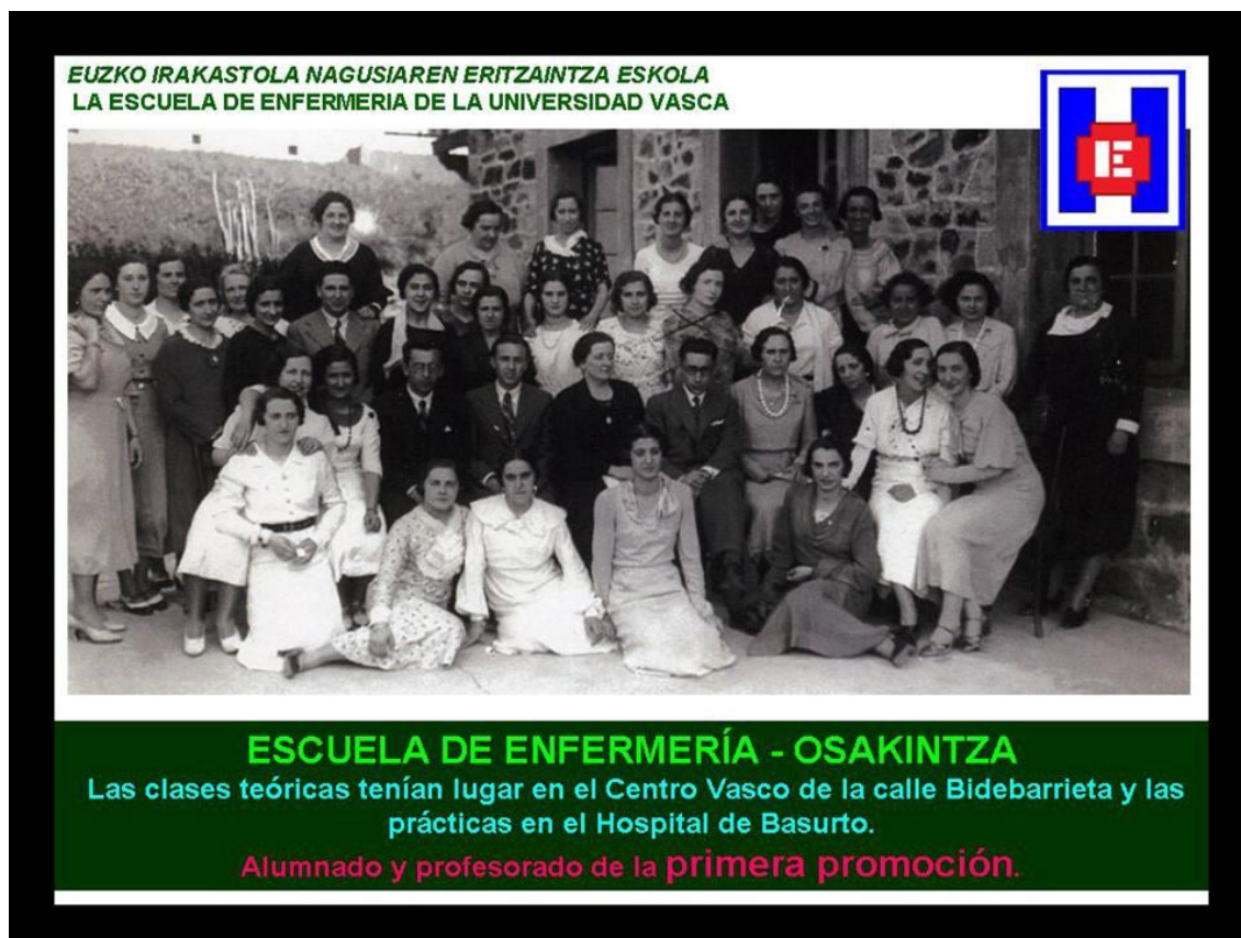
FOTO 7. Escuela de Enfermería.

Ese mismo día el periódico Eguna , publicaba un artículo en el que defendía la necesidad de formación de nivel superior para las enfermeras, por encima de las gexozaiñak , para dar respuesta a las necesidades de cuidados surgidas de los avances técnicos de la medicina 7 .