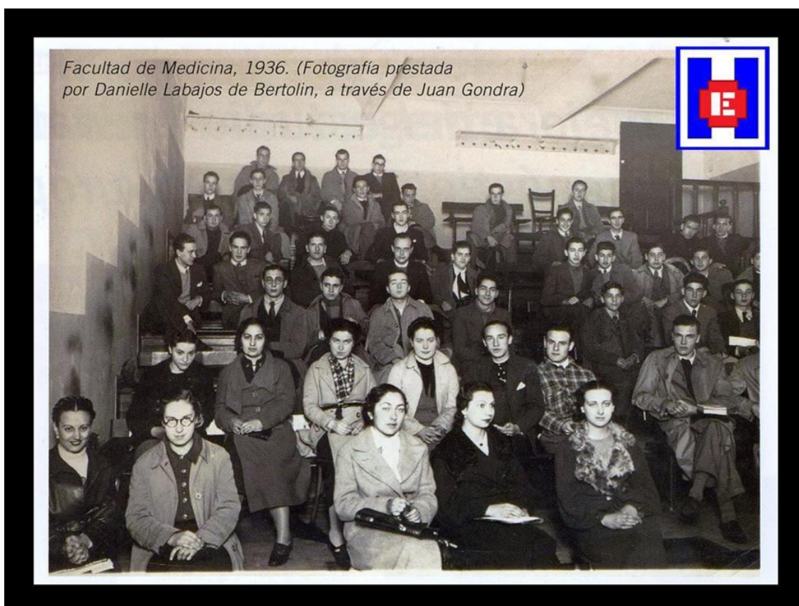
FOTO 6. Facultad de Medicina, 1936.

Se crea Osakintza – Facultad de Medicina y el Lehendakari Aguirre preside el 1 de diciembre de 1936, en el Hospital Civil de Basurto, el acto de apertura de la Universidad 1 .