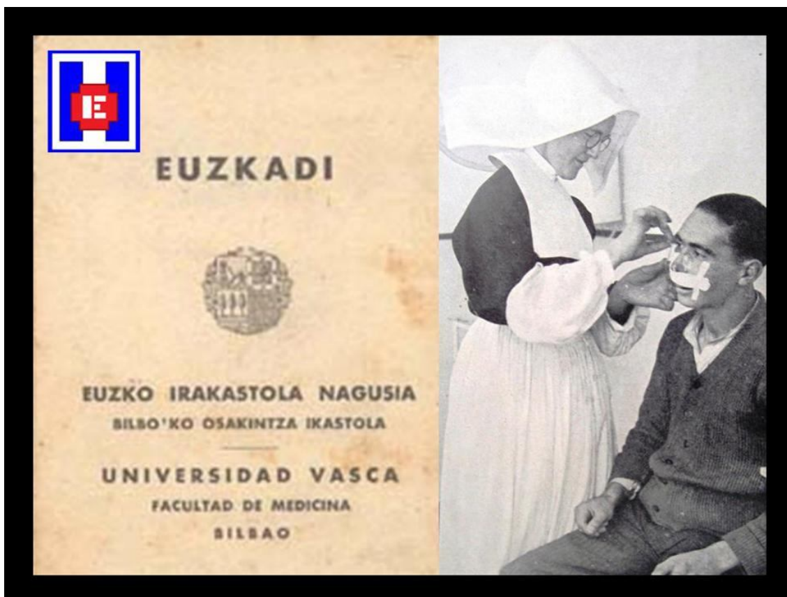
FOTO 3. Carnet de la Facultad de Medicina. Enfermera Hija de la Caridad curando a un enfermo

Para octubre de 1936, tras la práctica conquista de la provincia de Gipuzkoa el frente se estabiliza en torno a los límites de la provincia de Bizkaia, es decir, a unos 50 kilómetros de Bilbao. Hasta la caída de Bilbao se producen intensos combates, e incluso los primeros bombardeos aéreos sobre la población civil, como los ocurridos en Durango o en Gernika. Ese clima bélico que se respira en Bilbao lo recoge perfectamente Robert Capa en sus fotografías 5 .