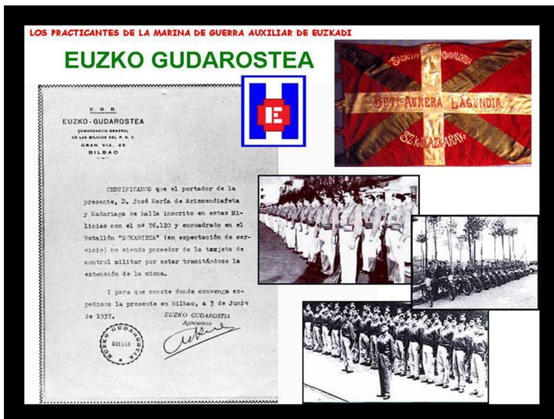
FOTO 4. El ejército Euzko Gudarostea que incluía la Marina de Guerra Auxiliar de Euzkadi , la policía Ertzaiña