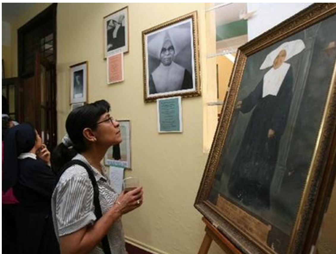
FOTO 001 Cuadro que hay en la Escuela Nacional de Enfermeras de Guatemala de Sor Ángela Virginia Lazo Midence

Sor Ángela nació el 12 de octubre de 1892 en la vecina República de Honduras, pero a los tres años de edad, fue llevada por sus padres a Guatemala, donde creció y se educó, obteniendo posteriormente la ciudadanía Guatemalteca. Hizo sus estudios primarios en el Colegio de Señoritas “Doña Concha Zirión de Saravia” y los de Maestra de Educación Primaria en el Instituto Normal Central para Señoritas Belén.