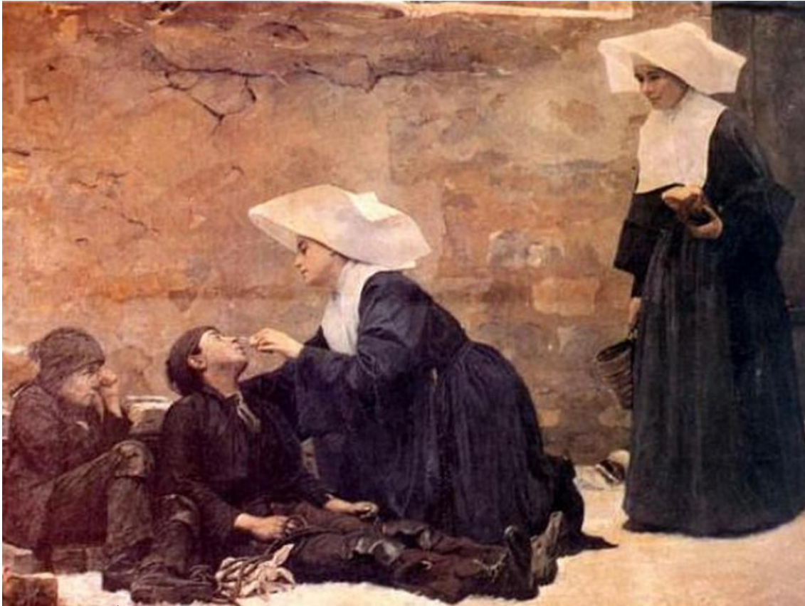
FOTO 002 Óleo de las Hijas de la Caridad

Fue organizadora del Primer Congreso Interamericano de Enfermeras, celebrado en septiembre de 1949, en San José, Costa Rica y auspiciado por la OPS/OMS, siendo Presidenta del mismo. Permanece hasta agosto de 1954 en Costa Rica, fecha en que el Gobierno de Guatemala le solicita asumir la Dirección de la Escuela Nacional de Enfermeras de Guatemala, donde lleva a cabo una total reorganización de la misma consistente en: