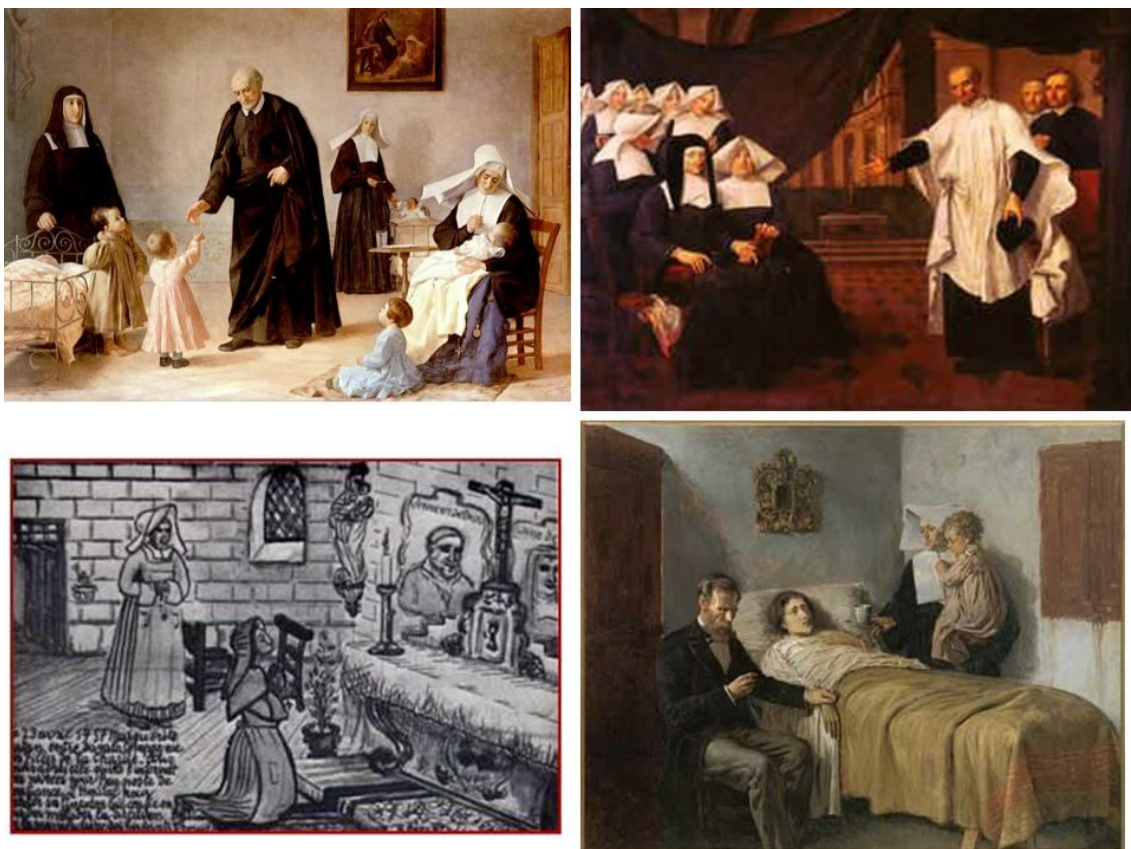
FOTO 003 Diferentes pinturas de las Hijas de la Caridad

Después de haber consagrado su vida profesional al Servicio de la Enfermería Guatemalteca, falleció el 5 de octubre de 1983, a la edad de 91 años (2).