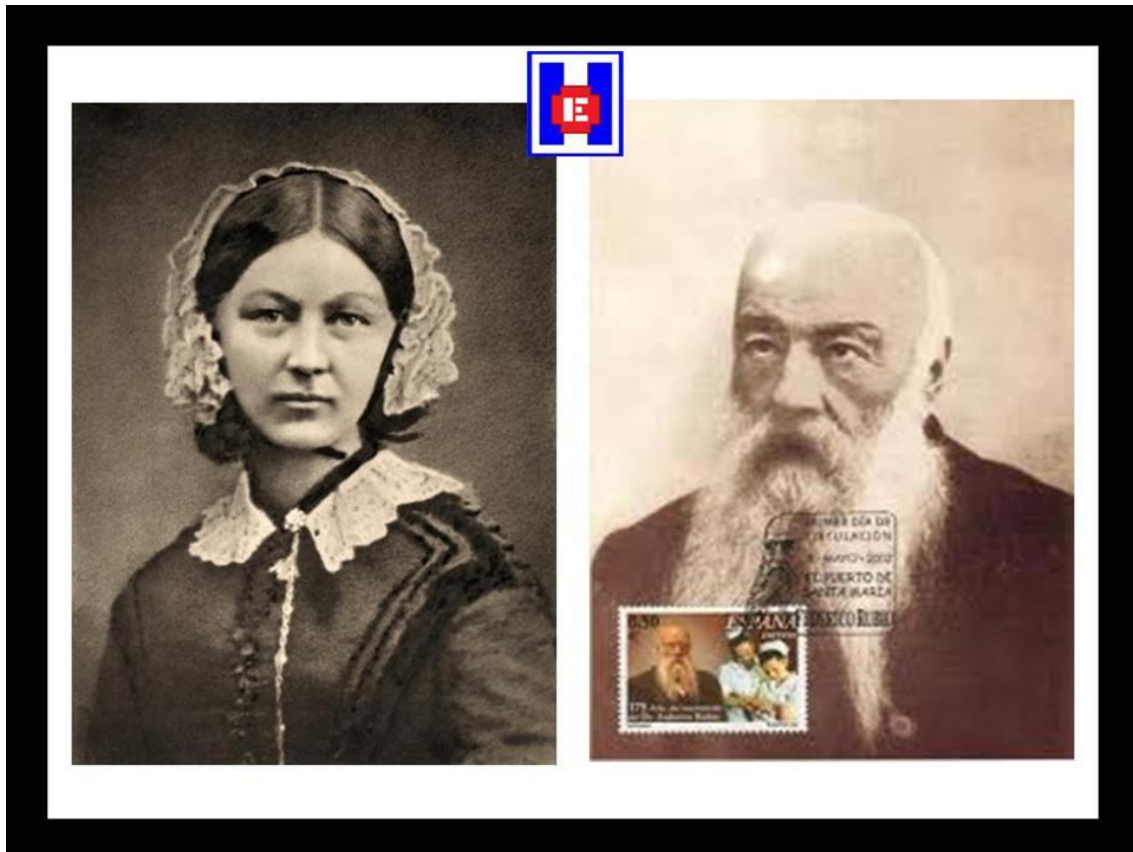
FOTO 4 Florence Nightingale. Federico Rubio y Galí

Surgiendo un análisis de contexto relacionado con distinción de género y la clase social que pudiese haber sido la causa de ese rechazo como mujer y enfermera, reflejada en el desarrollo de la Enfermería Contemporánea en España.