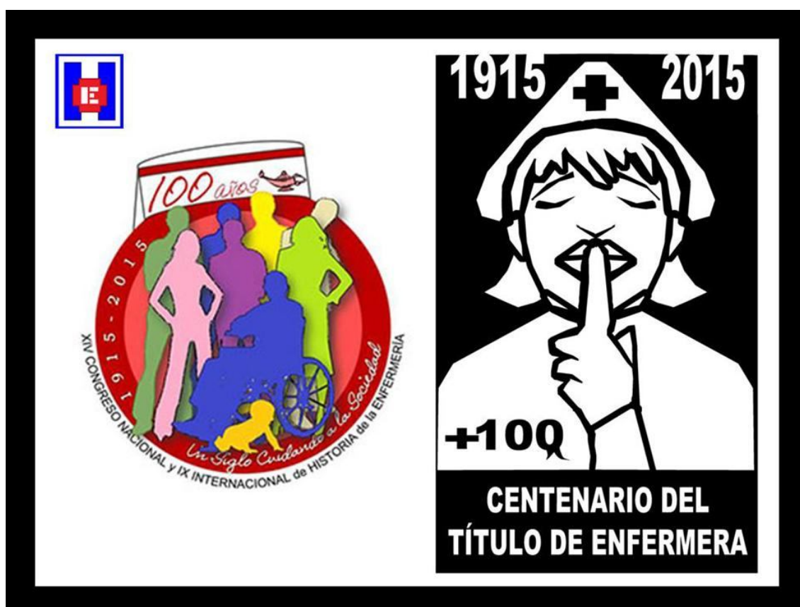
FOTO 2 Logo oficial del Congreso.