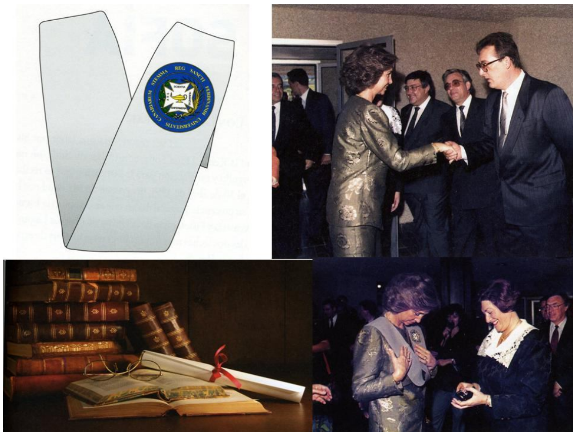
FOTO 005 Beca distintiva de la Enfermería. Su Majestad la Reina Doña Sofía y libros y manuales antiguos

También se hace referencia en este capítulo a los uniformes, símbolos y color, como eran los vestidos blancos, la lámpara, la cofia y la capa. Hoy en día muchos de estos símbolos ya no se utilizan, llevando el mismo color de uniforme o diferente según el estamento sanitario al que se pertenezca.