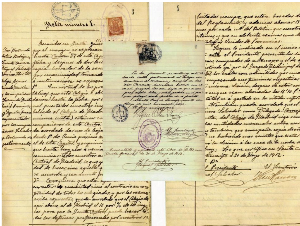
FOTO 004 Acta de creación del Colegio de 1912