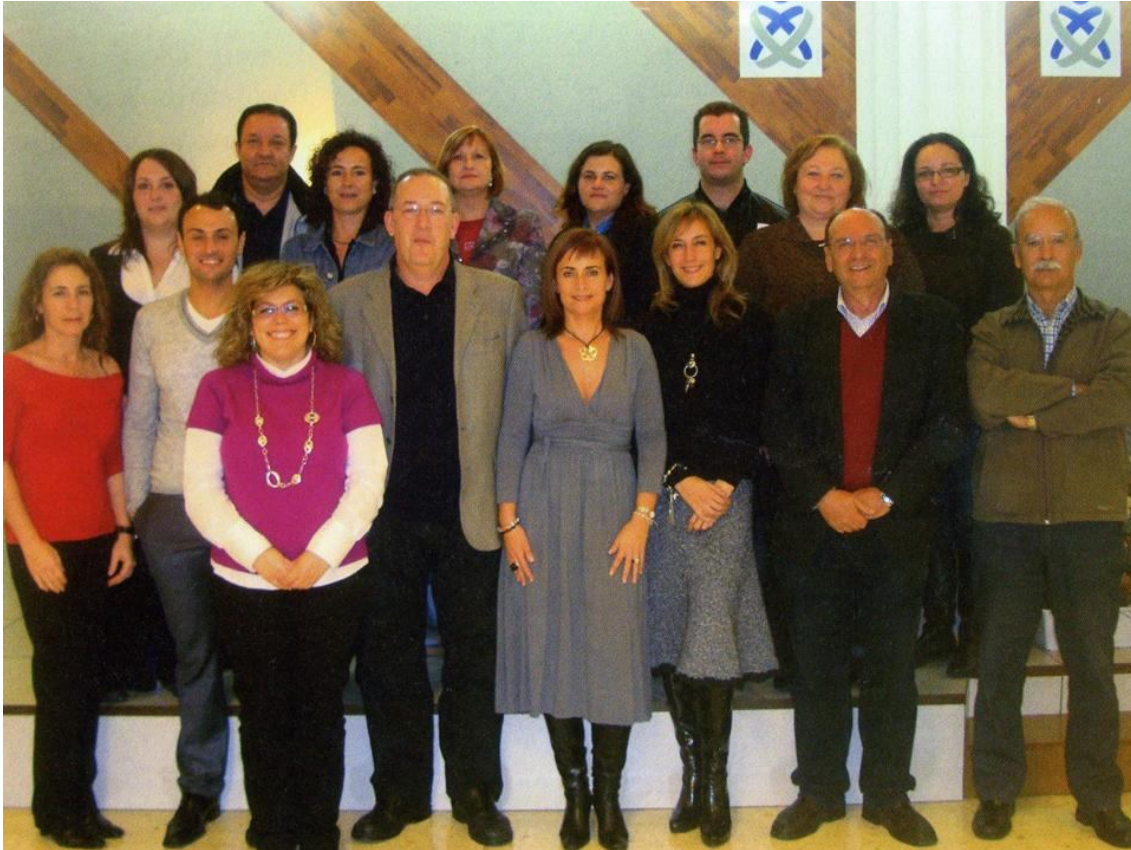
FOTO 007 Junta de Gobierno actual del Colegio de Enfermería. Santa Cruz de Tenerife