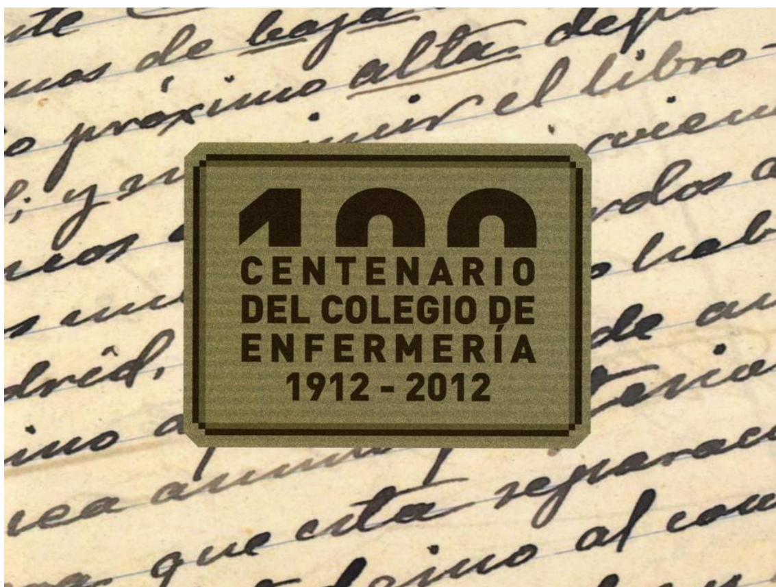
FOTO 002 Portada del Libro del Centenario del Colegio de Santa Cruz de Tenerife