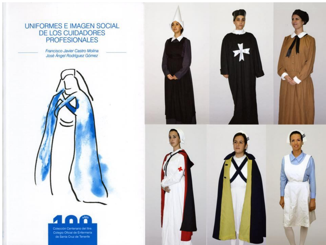
FOTO 008 Portada del libro e imágenes de los uniformes